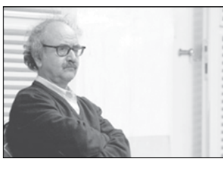
دکتر محمدرضا شفیعی کدکنی (استاد ادبیات ایران)

«احمد محسن پور» برای فرهنگ مازندران که پاره‌ای از سرزمین ایران است زحمت کشید و کار کرد. خود را در اندوه از دست دادن او که از اهالی فرهنگ بود شریک می‌دانم. امیدوارم راهی که ایشان در آن گام گذاشته بودند تداوم داشته باشد.