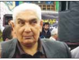
حسین اسلامی (نویسنده و تاریخ‌نگار)

مازندران است که هرگز فراموش نخواهد شد. مازندران حتی اگر نخواهد هم نمی‌تواند فعالیت‌های این چهره فرهنگی را ندیده بگیرد. این افراد هرگز نمی‌میرند. خدا هنرمند است و هنر یک عطیه الهی است. همه هنرمندانی که قدر خودشان را می‌دانند بخش خدایی در وجودشان بیشتر شکوفا شده است. ما مدیون هنرمندان در همه عرصه‌ها هستیم. چون حرف دارند و انتقال دهنده پیامی به جامعه هستند. محسن پور اندیشه خودش را با صدای سازش پیاده کرد و این ارزشمند است.