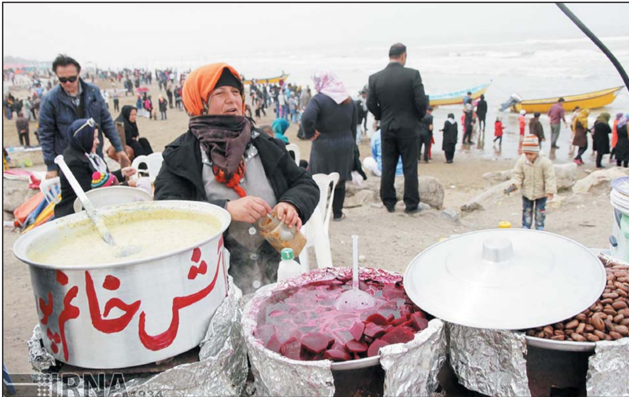
مرور مشاغل تابستانی کنار دریا

گروه گزارش، آتنا فلاحتی: روزهای گرم تابستان از گذشته با نام دریا همراه بوده است و بسیاری از مردم به ویژه شمالی ها به دلیل برخورداری از این نعمت طبیعی همواره از مواهب آن بهره برده اند. در نیمه های تابستان به سراغ مشاغل می رویم که شاید کمتر در کوچه و خیابان از آنها یادمانده باشد، اما در ساحل دریا، گرمای تابستان را به زمانی برای تفریح و خوش گذراندن اوقات فراغت بدل می کنند. این مشاغل که از گذشته برجای مانده است، جای خود را به حضور در سفره خانه ها و پارک های تفریحی داده است اما، گاهی شاهد حضور افرادی هستیم که خاطره یخ در بهشت و بلالی کنار دریا و قایق سواری را برای ما زنده نگه می دارند.